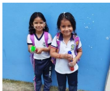
Vorbereitungen für Fasnacht